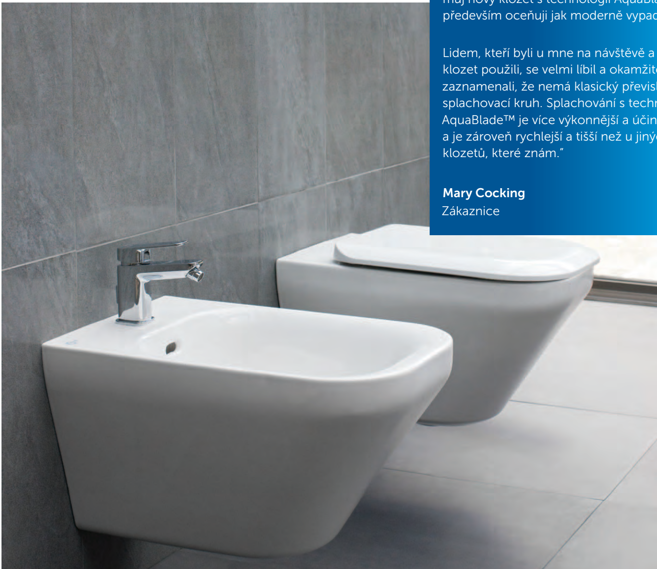
Mary Cocking Zákaznice

Lidem, kteří byli u mne na návštěvě a tento klozet použili, se velmi líbil a okamžitě zaznamenali, že nemá klasický převislý splachovací kruh. Splachování s technologií AquaBlade™ je více výkonnější a účinnější a je zároveň rychlejší a tišší než u jiných klozetů, které znám.“